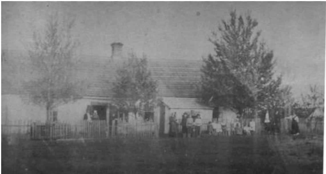
Дом в Максимилиановке, Украина