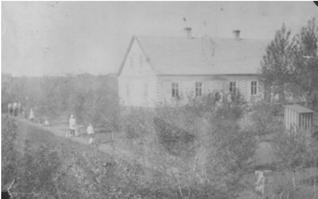
Дом в Максимилиановке, Украина